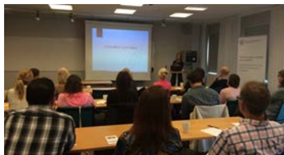
Vid Frukostmötet i september berättade Forskare om en studieöversikt över unga vuxna med komplex situation.

Totalt blev det sex stycken gemensamma forum och 143 personer har deltagit i insatsen gemensamt forum.