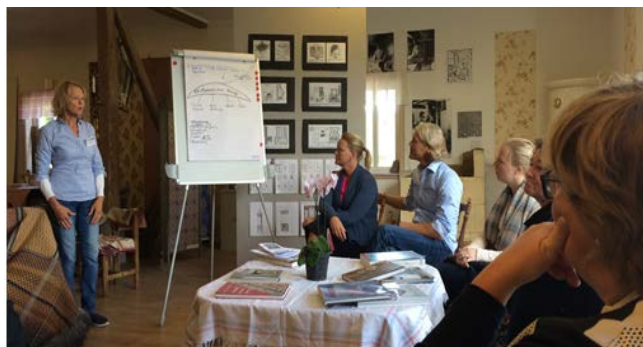
Styrelsens studiebesök 150909 med delar av Beredningsgruppen