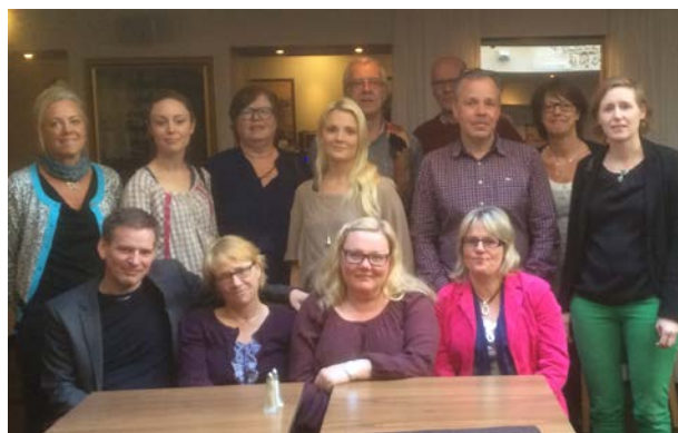
Förbundschefen och Östra Nätverket för Samordningsförbund

Under året har Vaxholm och Danderyds kommun träffat Förbundschefen och visat intresse att ingå i förbundet.