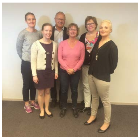
Ordförande och delar av Beredningsgruppen efter förbundets första frukostmöte.